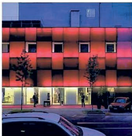
LA SEDE Frigoriferi Milanese, via Piranesi 10, info writersfestival.it