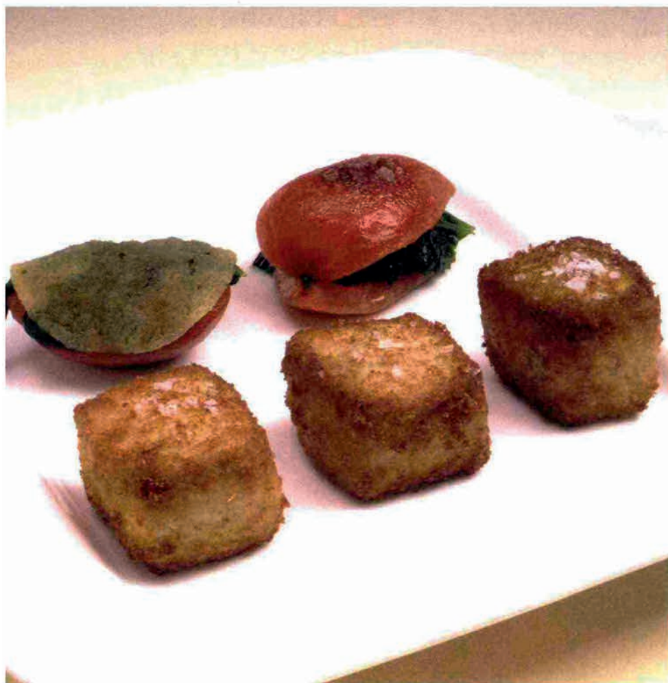
La prima "rivisitazione" firmata dallo chef Carlo Cracco: il vitello impanato alla Milanese