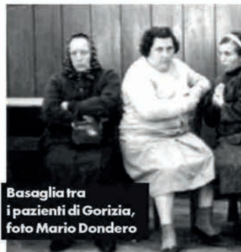
Basaglia tra i pazienti di Gorizia