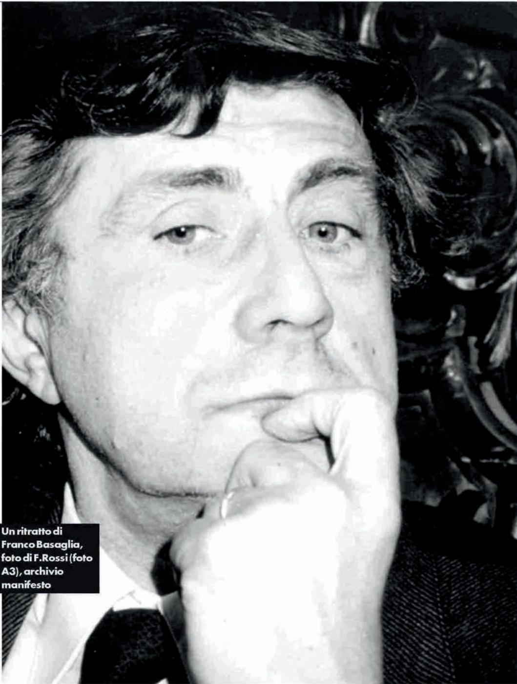
Un ritratto di Franco Basaglia, foto di F. Rossi (foto A3), archivio manifesto

Il primo atto di Milei è stato un decreto omnibus che conteneva anche la deroga alla legge sulla salute mentale