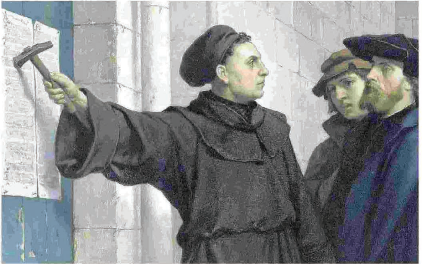
Sopra, "Lutero affigge le sue 95 tesi nel 1517" di Ferdinand Pauwels (1830-1904) Qui sotto la creatrice di Harry Potter, J.K. Rowling, 58 anni