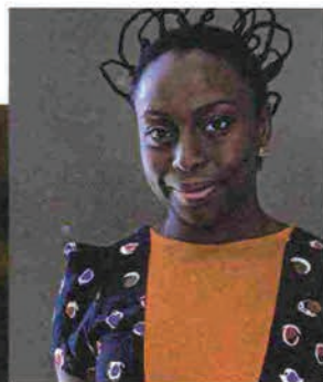
A fianco, la scrittrice Chimamanda Ngozi Adichie. A sinistra, il taglio simbolico di una ciocca in solidarietà alle donne iraniane. In basso, la cover del saggio All'aria sparsi (il Saggiatore).