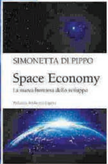
A sinistra la copertina del libro «Le città dell'universo» (Il Saggiatore), a destra «Space Economy» (Egea)