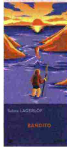
BANDITO DI SELMA LAGERLÖF, IPERBOREA, 19 EURO