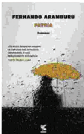
La riscoperta di "Patria"

quello a non arrendersi mai ecco «Gridalo» (Bompiani) di Roberto Saviano, un invito ad andare dove gli altri non hanno il coraggio, una mappa di storie del passato e del presente, da Ipazia a Giordano Bruno, da Anna Achmatova a Robert Capa e Martin Luther King.