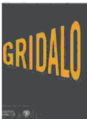
Roberto Saviano con "Gridalo"