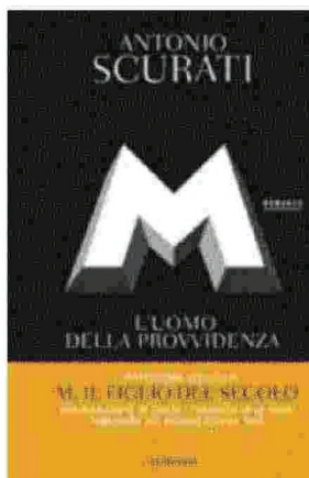
Scurati con il 2° volume sul Duce

Tra i titoli Bompiani da non perdere anche «M. L'uomo della provvidenza» di Anto-