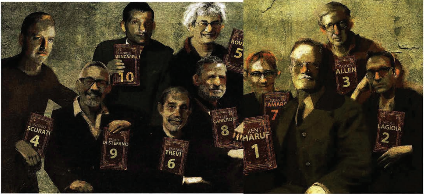
I primi dieci classificati nell'interpretazione di Antonello Silverini , autore delle quattro illustrazioni di queste pagine speciali