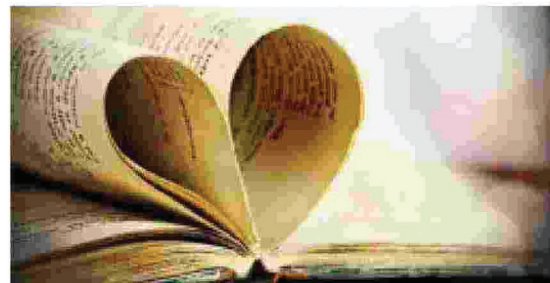
TUTTI I GENERI Dai classici ai gialli, fino al saggio e il racconto breve