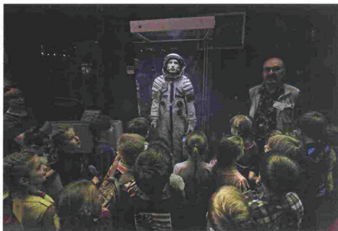
Da sinistra. Moving to Mars a Londra. Il Memorial Museum of Cosmonautics di Mosca. Lo Space Vehicle Mockup Facility del Nasa Johnson Space Center, a Houston, e un elaborato della The Moon Village Association (MVA), a Vienna.