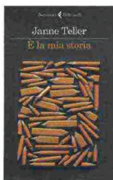
JANNE TELLER È LA MIA STORIA

Mappa dei moti del cuore e insieme diario di viaggio in un'Italia inconsueta, lontana dai luoghi comuni. Un memoriale intimo, che si fa commovente riscoperta della bellezza nascosta nei dettagli.