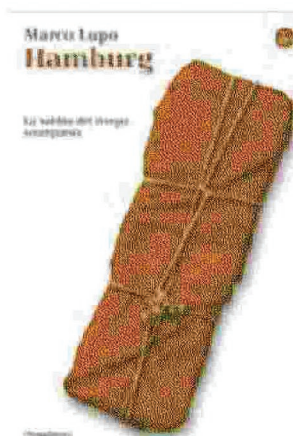
Il romanzo edito da il Saggiatore

Amburgo, la città tedesca sullo sfondo nel luglio 1943, sfugge alla linearità del racconto per mutarsi, tra finzione e realtà, incubo e ricordo, in un coro di vite e memorie. «Hamburg - si legge nella motivazione del premio - è un libro sulla labilità della memoria e su come venga tramandata da un gruppo di lettori clandestini. In un mondo di macerie che ricorda le atmosfere di Fahrenheit 451, un coro di voci si ritrova, segretamente, ogni lunedì in una libreria. Non si tratta di una “allegra brigata” che si ritira su un colle ameno, bensì di una banda di resistenti che scorge nella lettura la medesima funzione che gli uomini primitivi attribuivano agli affreschi delle grotte di Lascaux. Anche l’autore, in effetti, dichiara che “si scrive per dar voce ad animali morenti”. Hamburg mette in scena uomini e donne sconfitte dalla storia, famiglie costrette a nascondersi sotto terra per sfuggire al bombardamento alleato che