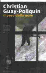
Il peso della neve , di Christian Guay-Poliquin, Marsilio, 17 euro

È nato nel 1982 a Saint-Armand, un piccolo villaggio del Québec, in Canada. Ha studiato all'università di Montreal, laureandosi in Letteratura francese. Il suo primo romanzo, Le fil des kilomètres , è uscito nel 2013 (in Italia non è stato ancora tradotto). Il peso della neve , idealmente un sequel perché il protagonista ricorda quello del primo libro (un uomo che attraversava il Canada per tornare dal padre che non vede da dieci anni), gli ha regalato invece il successo internazionale. Il romanzo ha ottenuto tutti i più importanti riconoscimenti letterari canadesi, tra cui il Governor General's Literary Award, l'equivalente del nostro premio Strega.