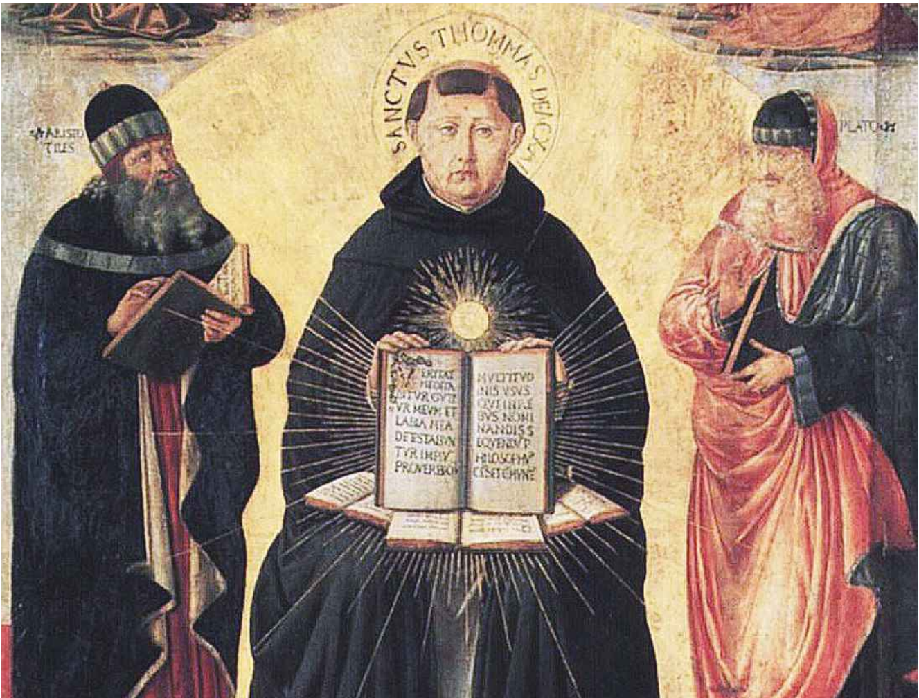
Il Trionfo di San Tommaso d'Aquino (1471) di Benozzo Gozzoli (Museo del Louvre)

Ritaglio stampa ad uso esclusivo del destinatario, non riproducibile.