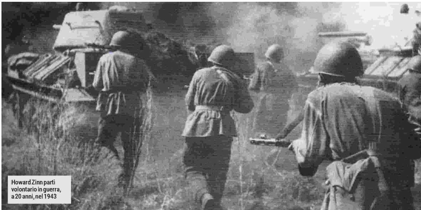
Howard Zinn parti volontario in guerra, a 20 anni, nel 1943

Howard Zinn "Disobbedienza e democrazia. Lo spirito della ribellione" Il Saggiatore pp. 491, euro 29