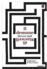
IL DEMONE DI MAXWELL DI STEVEN HALL, IL SAGGIATORE , 23 EURO

Mondi virtuali, quesiti di fisica, misteri. Un affascinante rompicapo che tiene incollati fino all'ultima pagina