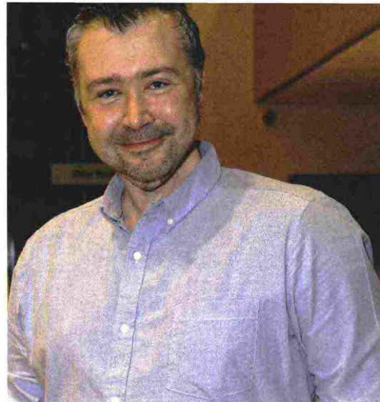
Lo scrittore inglese Steven Hall, 47 anni.

UN AUTORE DA SCOPRIRE, Steven Hall: con il primo romanzo, Le memorie dello squallido , vince numerosi premi e viene considerato fra i migliori scrittori della sua generazione. Poi per quasi 14 anni se ne sta in silenzio, dedicandosi alla scrittura di videogame, come il notissimo Battlefield 1 . Mondi virtuali complessi che hanno affinità con questo libro, un affascinante rompicapo che impegna chi legge a districarsi in un continuo gioco di rimbalzi e cambi di scenario, tra il fantasy, il giallo, la fisica, insieme a una ricerca sulla creazione letteraria, sulla natura del tempo e di Dio.