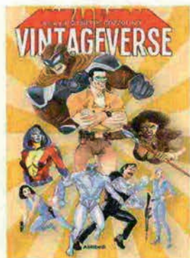
ALIRIBELLI, € 15