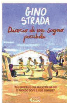
Diario di un sogno possibile di Gino Strada FELTRINELLI, Pagg. 176, EURO 14

Un libro per tutti: per i ragazzi che saranno il futuro, e per i sognatori che non si rassegnano a che il futuro sia solo un destino. La storia e l'utopia pratica di Gino Strada sono raccontate in queste pagine, illustrate da Marcella Onza, perché l'esempio vale più delle teorie. «Non si può dire che una cosa è impossibile finché non provi a farla. E se vedi che non ci riesci, allora tenta in un modo diverso» diceva il fondatore di Emergency. Qui se ne ripercorre il percorso, dall'infanzia a Sesto San Giovanni e dalla formazione come chirurgo, all'impatto con il suo lavoro in un Paese in guerra e il sogno di cancellare l'ingiustizia e la guerra nel mondo, per ridare dignità e salute a ogni persona. Giulia Calligaro