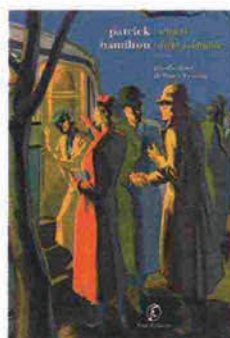
Gli schiavi della solitudine di Patrick Hamilton FAZI, Pagg. 304, EURO 20