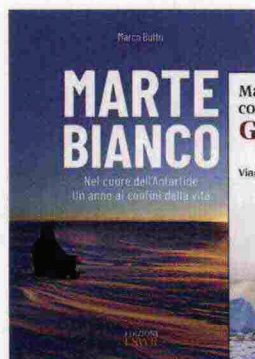
Marco Buttu, Marte Bianco , Edizioni Lswr, 197 pagine, 24,90 €