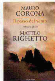
Mauro Corona, Matteo Righetto, Il passo del vento. Sillabario alpino , Mondadori, 228 pagine, 18 €

Non è un manuale, anche se le voci che lo compongono, dalla A di abete alla Z di zuppa, consentono una lettura discontinua. Quello di Mauro Corona e Roberto Righetto è un sillabario alpino: racconti della memoria, aneddoti più o meno autobiografici, pensieri, provocazioni. E qualche consiglio per vivere la montagna con consapevolezza e rispetto. Ce n'è bisogno.