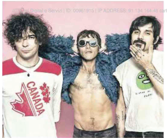
UN ALTRO POP È POSSIBILE A sinistra lo Stato Sociale e, a destra, gli Zen Circus. Sotto, le copertine dei loro libri