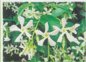
Fiori di falso gelsomino.

Consigliamo di dare un bel taglio alle radici del falso gelsomino se lo possedete da qualche anno. Questa pianta ha uno sviluppo radicale rapido e vigoroso, per cui le radici riempiono il vaso in fretta, invadendo il pane di terra, che si compatta. Di conseguenza, diventa impossibile per le radici assorbire acqua e concimi. Per evitare questo