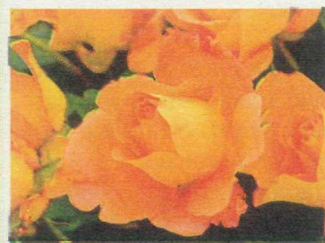
Alcuni boccioli di rosa.

ROSE È arrivato il momento di potare le rose, adesso che la caduta delle foglie si sta esaurendo e non è ancora iniziata l'emissione dei nuovi germogli. Infatti i tagli ser-